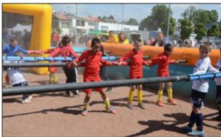
Le baby-foot humain a connu un énorme succès !