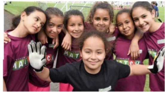
Les équipes filles heureuses de taquiner le ballon rond.

26 mai 2017 à 05:02 | mis à jour à 20:18