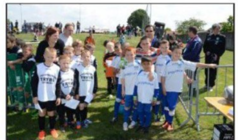
Une longue attente pour l'épreuve de tir au but.